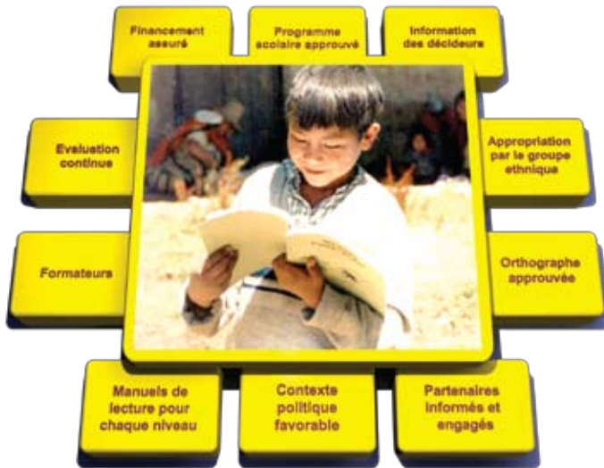
Schéma conçu par Susan E. Malone, doctorat en sciences de l'éducation

Composantes d'un programme d'éducation multilingue durable