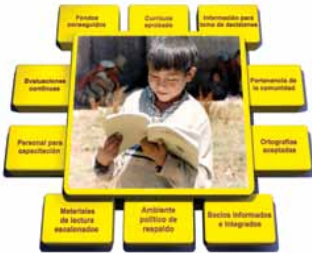
Gráfico por Susan E. Malone, Ph.D.

Componentes de Programas Sostenibles de Educación Multilingüe